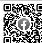
Facebook da KIA