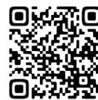
Informativo completo (Japonês)