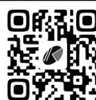
Página da KIA