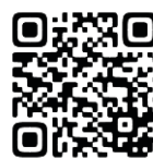
Página de Kakamigahara

Atendimento segunda à sexta, 8:30 ~ 17:15 (Atendimento em português 9:15 ~ 17:15) 504-0912 Kakamigahara-shi Naka Sakura-machi 2-186 Edifício Sangyo Bunka Center, 6F. Telefone 058-383-1417 090-3557-3160 E-mail salon@kakamigahara.vrtc.net Website www.kia1986.org (Kakamigahara International Association) Facebook @kiakakamigahara * Entre em contato com a conosco para receber este informativo em sua casa gratuitamente