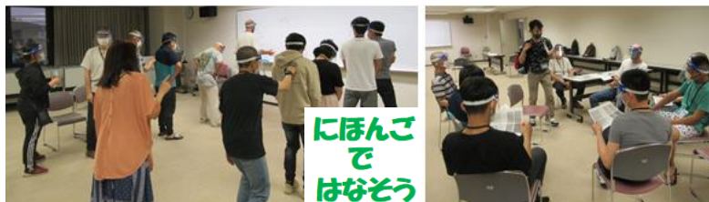
にほんご で はなそう