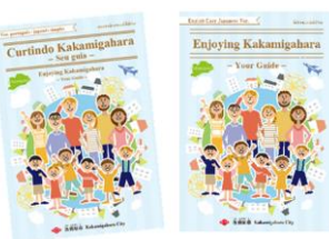
外国人市民向け 生活ハンドブック 作成支援 4月より配布