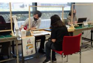
外国人市民 コロナワクチン 接種予約支援 4月30日～