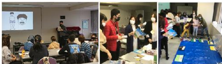
ホテル日本語講座 支援