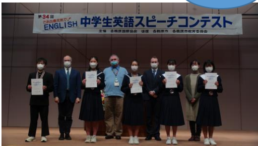
入場者を制限しオンラインでも配信

昨年に引き続き2021年も、繰り返し押し寄せる新型コロナウイルス蔓延の波に翻弄された1年でした。各務原国際協会（通称KIA）も、事業の中止や縮小・見直しを余儀なくされる中、“今できること”、“今やるべきこと”を模索しつつ事業を展開いたしました。