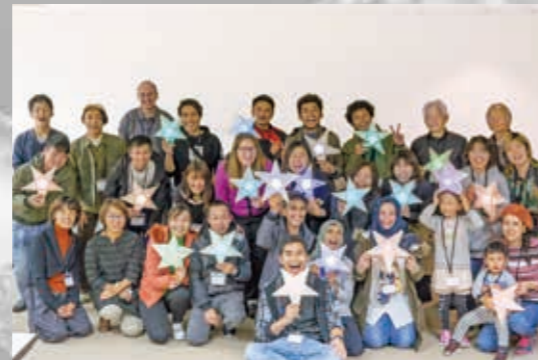
日本語で話そう！ (フィリピンの飾りパロルのワークショップ)