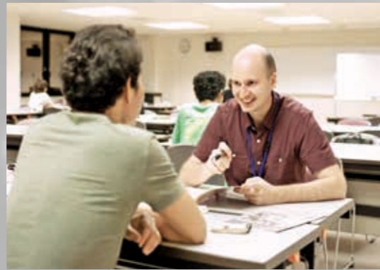
日本語講座 (毎週水曜日 18-21 開催)