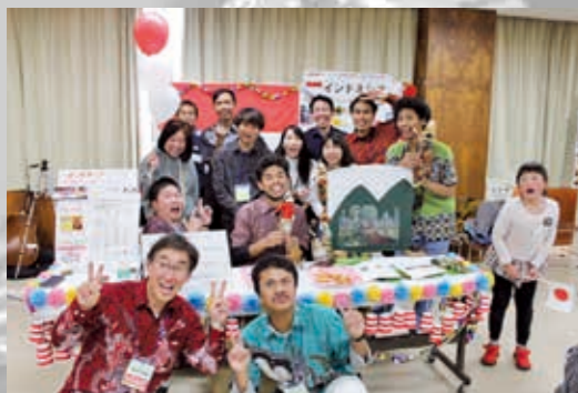
KIA フェスティバル 2019 インドネシアブース

次ページでは、このイベントに参加したトルコブースのバイラークさん、インドネシアブースやステージイベントを行ったハムバリーさん、ブラジルブースのナイルさん、運営ボランティアの木造さんにKIAフェスへの思いを語ってもらいました。