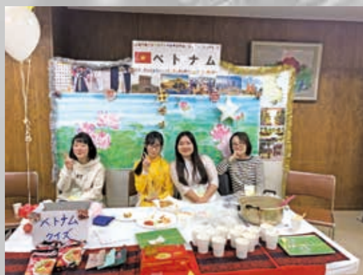
KIA フェスティバル 2019 ベトナムブース